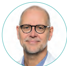
Prof. Dr. med. A. J. Dormann Kliniken der Stadt Köln gGmbH